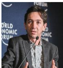
マウリシオ・ラザラ・レイボヴィッチ氏 (Mauricio Lazala Leibovich) Office of the United Nations High Commissioner for Human Rights (OHCHR) Chief of the Business and Human Rights Section

マウリシオ・ラザラ・レイボヴィッチ氏は、現在、国際連合人権高等弁務官事務所（OHCHR）においてビジネスと人権課の課長を務めている。同氏は、市民社会分野において豊富な経歴を有し、20年以上にわたり、調査、アドボカシー、政策、マネジメントに携わってきた。専門分野は、ビジネスと人権、デジタル権利、市民的空間、企業の説明責任、組織開発である。これまで複数の国で活動し、3言語に堪能である。政治学の学士号と法学の修士号を有している。